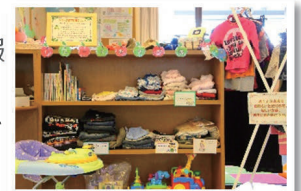
リユースむすび隊コーナー

リユースむすび隊は、使わなくなった育児用品や洋服を通じて、人と人の輪をつなげていこうという思いから、誕生しました。洋服からベビーチェアなどの大きなものまで、“無料”でお預かり・お譲りしています。