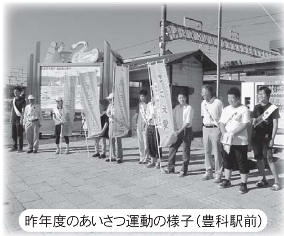
昨年度のあいさつ運動の様子(豊科駅前)