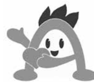
マスコットキャラクター あづみん