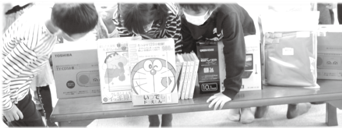
頂いた寄付品など