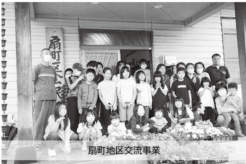
扇町地区交流事業