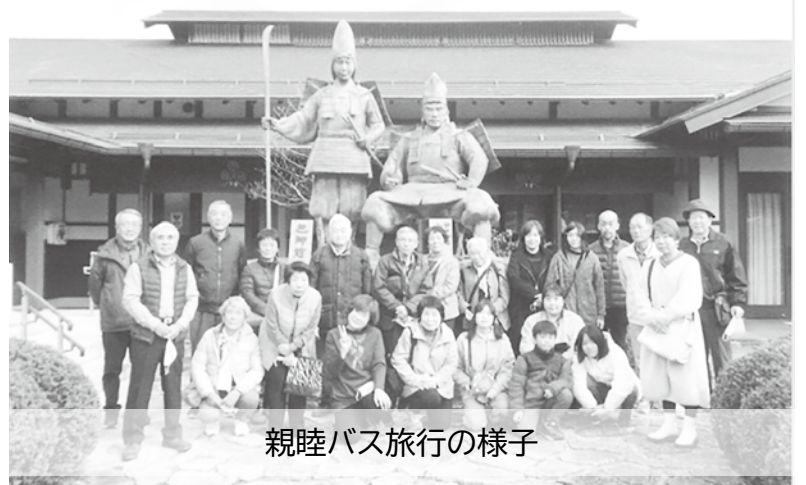
親睦バス旅行の様子