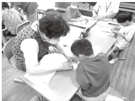
一緒に作業しています!!