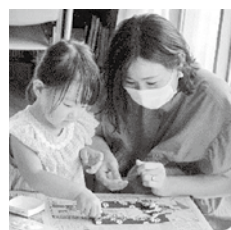
フォトフレームづくりの様子

児童館では、地域の多くの皆さまのお手伝いをいただきながら様々な行事を行っています。ぜひご参加ください。お待ちしております♪