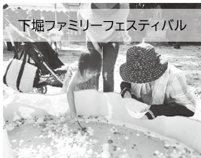
下堀ファミリーフェスティバル

ようやくコロナ禍も落ち着いてきました。この夏からはまた、「下堀ファミリーフェスティバル」での子どもたちの歓声とともに、住民のふれあいやも広がっていくことと思います。