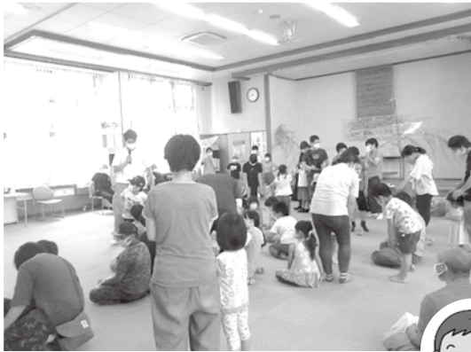
学生によるレクリエーション

令和3年6月に発足した「あづみの cocoro カフェ実行委員会」は、毎年4回のカフェを行い、生活に余裕の持てない子どもがいる家庭等に、食事や食品のほか、子どもたちのレクリエーションなど交流の場を提供しています。また、毎月1回以上フードパントリーを実施し、お菓子やお米、野菜など、多くの市民の皆さま、市内企業やNPOホットライン信州様などから寄付していただいた食品を提供しています。