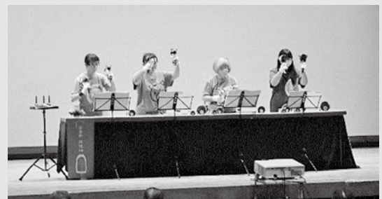
三匹のこぶたの皆さん

当日は、「遠き山に日は落ちて」「笑点のテーマ」「安曇野市歌」の楽曲を演奏していただきました。大小さまざまな種類のハンドベルが織りなす清らかな音色が来場者を魅了しました。