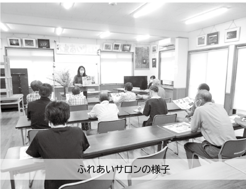
ふれあいサロンの様子