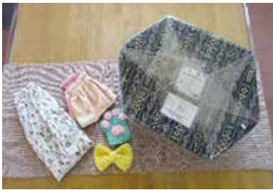
ぞうきんなどの材料になります。

すてっパークの各事業所では、施設ごとに個性あふれる自主製品を製作・販売しています。