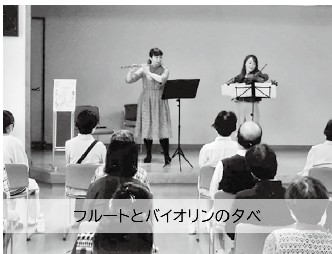
フルートとバイオリンのタベ

これからも事業内容を工夫しながら区民の皆さまとの交流を図っていききたいと思っています。