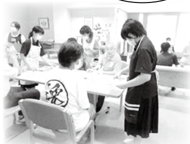
喫茶うさぎ 特別営業