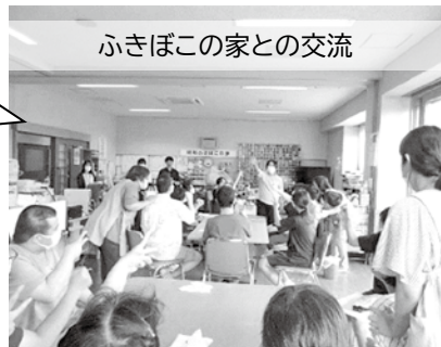
ふきぼこの家との交流

9月8日15時～16時 1時間だけの特別営業 ふきぼこの家の利用者と中学生がペアを組み、店員として運営しました。