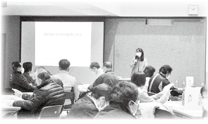
明科 ささえあいマップ