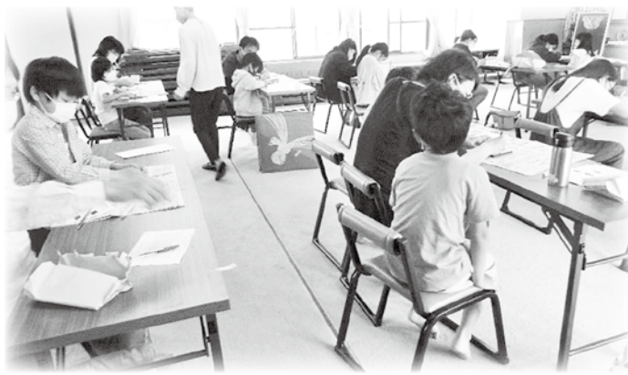
穂高 穂高区 沈金講座

SAN 一日市場新聞販売 HAMA フラワーパーク安曇野 HIYOKO (有)アードバンス (株)アグロ信州中信営業所 NPO 法人アルウィズ イブキ建設(株) インテリア曾山 (有)エル電気 クボタ建窓(有) (有)サイキ塗装店 サンシンエクスプレス(株) セブンイレブン安曇野温店 (有)タカギ タカサワ通商(株) デイサービスまがりっと太田屋 (有)トクデン産業 バイクショップエムハウス ビューティーサロン・ツルミ 赤津整形外科クリニック 赤羽歯科医院 安曇野珈琲工房 安曇野設計室 (有)安曇野ファミリー農産 安曇野ワイナリー(株) 犬の美容室クー 丑山一笑園 丑山自動車(有) (有)大久保自動車 大倉自動車(有) 開運堂あづみ野菜遊庭 環境未来(株) (有)久根下商店 NPO 法人子育て支援ぱおぱお