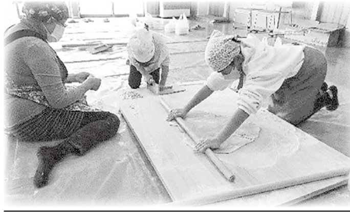
堀金 小田多井地区 そば打ち体験交流会