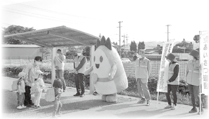
堀金 あいさつ運動