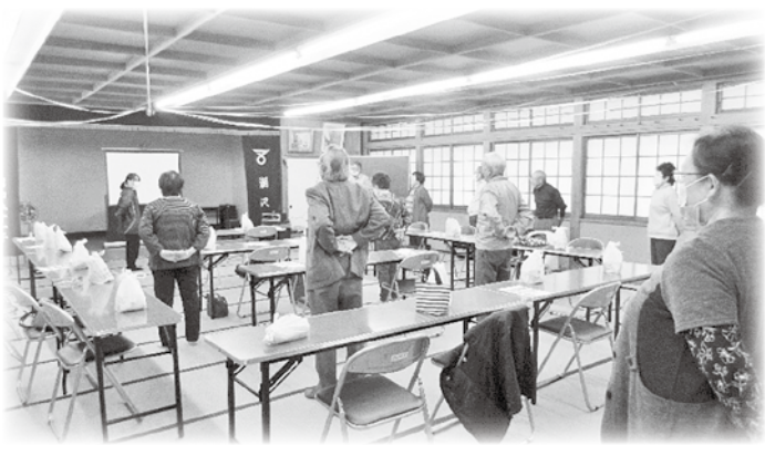
明科 サロン(潮沢地区)