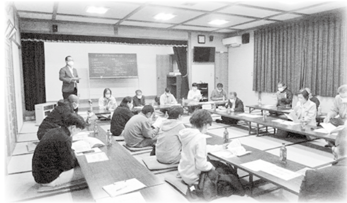
穂高 等々力区 福祉員説明会