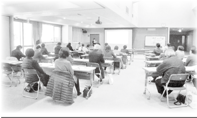
明科 認知症サポーター養成講座