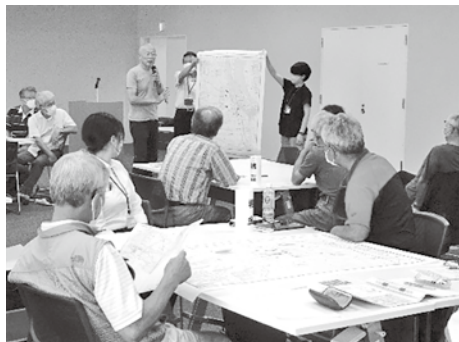
災害ボランティアサポーターとして 54名の方が登録されています。

地域で誰一人取り残さず皆が一緒に復旧していくためにも災害ボランティアサポーターの力はとても大きなものです。