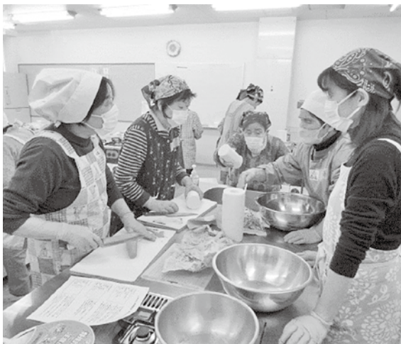
ふれあい料理教室「おせち作り」の様子 (明科)