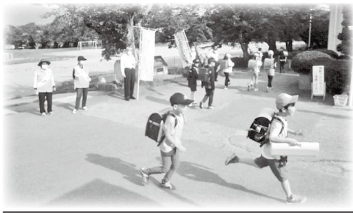
豊科 あいさつ運動

(有)小柴屋 (株)相模組中信支店 (有)さみぞ工務店 山清電気(株) (医)至誠会小穴クリニック 四川乃華安曇野店 篠崎訪問看護ステーション 下村塗装店 浄土宗法蔵寺 (有)白井商店 (株)振興建設 (株)信交社 信州坊主ほのか (有)信州保温 (有)新谷建設 (株)水宗園本舗 鮎・割烹一心 そうごう薬局豊科店 そば処一葉 (株)第一印刷 (有)大気堂 大黒屋 太陽建機レンタル(株)豊科支店 (株)武重商会 田沢川窪建設(有) 立石簡易郵便局 誓いの森イストアール 中華上手 中部住研(株) 塚田不動産(株) 土居歯科医院 東海不動産 鳥羽工業(有) 豊科カントリー倶楽部