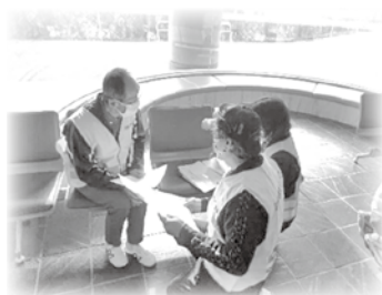
被災者のニーズ聞き取り訓練

先日、災害時にセンターの開設及び運営を円滑に行えるようにするために、社協職員と災害ボランティアサポーター39名が参加し、センターの設置・運営訓練を実施しました。