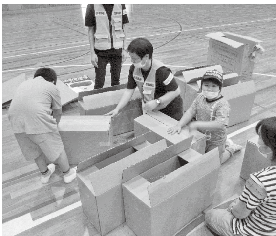
災害・防災塾の様子