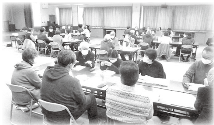
豊科 災害時支え合いマップ研修会