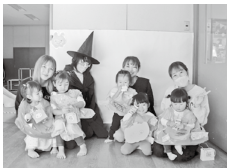
豊科中央児童館「ハロウィン」の様子

児童館が企画して参加していただくものと、保護者の皆さんがグループに分かれて企画して行うグループ活動があります。親子の出会いや体験、健やかな成長を応援させていただきます。