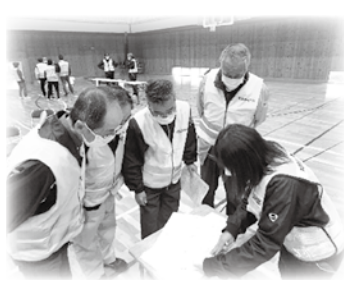
ニーズとボランティアをマッチング

今回は、より被災地に近い場所に設置するセンター（サテライト）の訓練も併せて行いました。