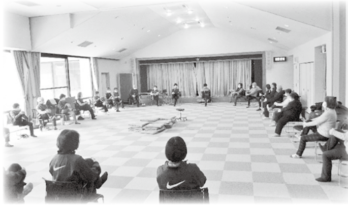
穂高 介護予防教室 穂高いきいき元気塾