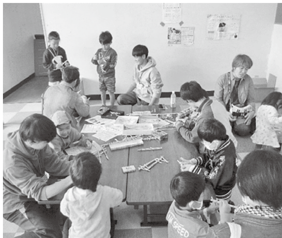
わんぱく広場ふれあいまつりの様子 (穂高)