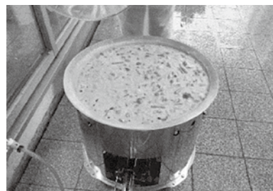
200食分の野菜たっぷりシチュー