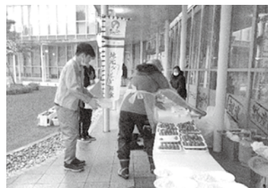
たくさんの「ありがとう」をいただきました。

翌日は、「鵜川小学校避難所」で昼食の炊き出し、「コンセールのと避難所」で夕食の炊き出しを行いました。それぞれ20食の「野菜たっぷりうどん」と「クリームシチュー」を作りました。先に派遣された支援団体から「野菜が摂れていない」との連絡があり、どちらも野菜を中心とした炊き出しを行いました。避難所で生活している方を優先しながら、周辺で在宅避難している方には鍋を持参していただき、人数分をお持ち帰りしていただきました。避難や通常の生活には程遠い生活を強いられるにもかかわらず、皆さまからは、「ありがとう」「とてもおいしかったよ」と声をかけていただきました。私たちはこれでもまた通常の生活に戻りますが、被災された皆さまは、まだまだこうした生活が続いていきます。一刻も早い復興を心より願っています。