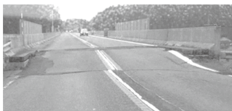
大きな段差ができてしまった車道

能登町までの道中は、地震の大きな爪痕が残っていました。七尾市から能登里山海道に入ると、道路の路肩のアスファルトが細かく割れ、ばらばらに浮き上がっていました。また、車道も片側が崩れている箇所や、橋の手前の道路が沈み段差ができている箇所があるなど、地震の激しさを目の当たりにしました。能登海道も途中から通行止めになっており、一般道を利用しました。 初日の夜は、能登町役場前の駐車場をお借りし、車中泊をしました。