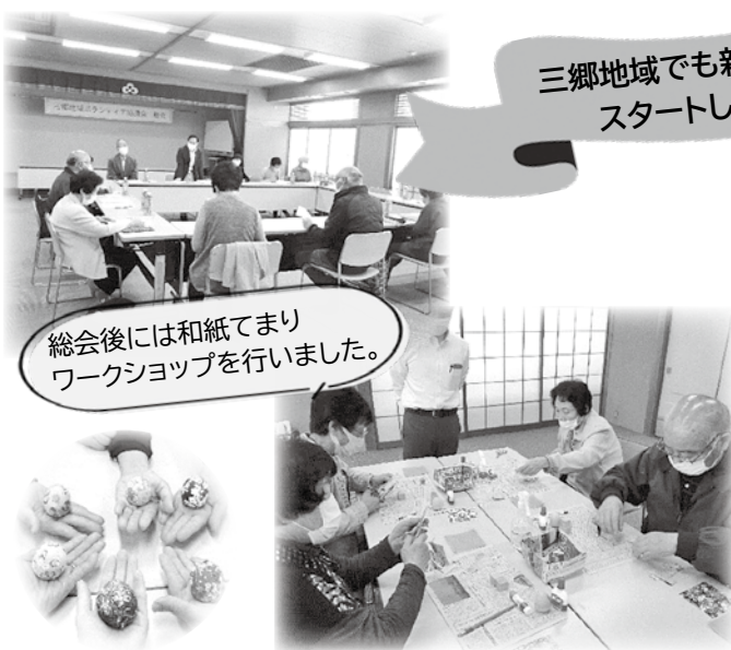
総会後には和紙でまり ワークショップを行いました。

三郷地域ボランティア協議会は、三郷を元気にしたいという思いから、ポッチャや演奏会などによる交流会、福祉施設等を見学する視察研修など、地域の人々がつながり、楽しめる活動を実施していきます。