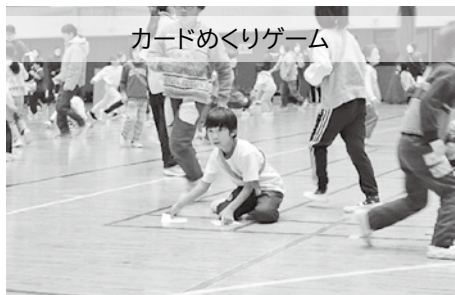
カードめくりゲーム

令和6年11月30日(土)、穂高総合体育館にて、「アツミンピック2024みんな運動会」を開催しました。安曇野市にある9児童館から、約210名の児童が参加し、赤組(南穂高、高家、三郷、明科)と白組(豊科中央、穂高中央、穂高西部、穂高北部、堀金)に分かれ、5種目の競技を楽しみました。