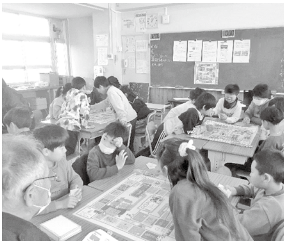
ふれあい体験「防災ゲーム」の様子(豊科)