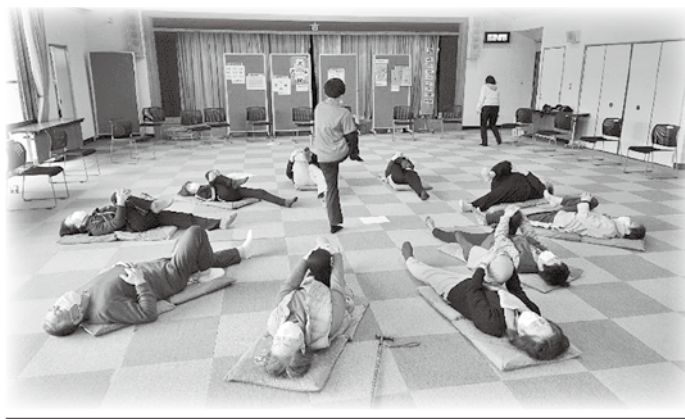
穂高 介護予防教室 穂高いきいき元気塾①

(株)ニシワキ 日東建設(有) (株)日本葉緑素長野支社 (有)ニュー電子工業所 根津内科医院 (株)ノムラ (株)ハーモニックドライブシステムズ (株)ハギワラ 畠山醸造(株) (同)ハタ研 (有)林茂商店 (有)原野製菓 (有)P&K KEY' SPLACE ヒカリ歯科医院 Vif穂高 ファミリーマート穂高矢原店 フジヒタチ(株) 古川医院 (株)フロンティア薬局穂高店 (医)朋有会山本歯科クリニック (株)ホタカ 穂高温泉供給(株) 穂高観光(株) 穂高カントリー(株) (株)穂高自動車