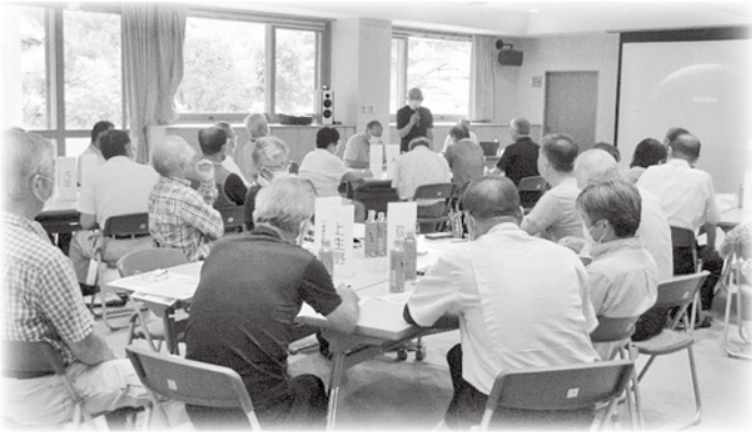
明科 ささえあいマップ研修会