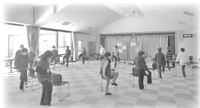
穂高 介護予防教室 穂高いきいき元気塾②

キッセイ薬品工業(株)中央研究所 京島クリニック 共和アスコ(株) 共和興業(株) グリーンゴルフ武島 上月歯科医院 (福)孝明孝穂館 (有)穀屋金物店 (株)言ノ葉 (有)小林製作所 (株)小宮山製菓 古民家デイスサービス匠 (有)近藤造園 (株)サーキットデザイン (株)彩香 佐々木会計事務所 さとう歯科医院 佐野歯科クリニック (株)サンキ サンクスクリエーション(同) (株)サン工機 三陽商事(有)あづみ野支店 サンリン(株)あづみ野給油所 サンリン(株)穂高支店 (株)GSユアサ安曇野 (株)G・フレンドリー安曇野営業所 ジェーシーシーエンジニアリング(株) 信濃内科循環器科医院 (株)市民タイムス安曇野支社 (有)就一郎漬本舗 (宗)正真院 昭和産業(株)穂高生コン工場 伸栄工業(有)