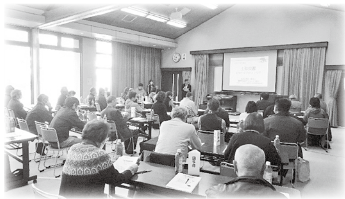
堀金 堀金地域防災研修会