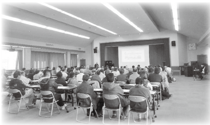
豊科 豊科地域防災研修会

◆金50,000円 株式会社清沢建築設計事務所 株式会社ワーク ◆金30,000円 有限会社ケルン タイラ不動産株式会社 ◆金25,000円 安曇野赤十字病院 ◆金20,000円 赤羽保険事務所 有限会社アルプス薬局 株式会社越前かまや 株式会社小川原設計 金龍寺 久保田ミクロン製作所 株式会社ティー・アイ・ピー 株式会社デンソーエアシステムズ長野工場 株式会社長野銀行豊科支店 南安タクシー有限会社 八十二銀行豊科支店 はれのひ耳鼻咽喉科クリニック 株式会社ライフワン ◆金15,000円 有限会社赤羽電気商会 株式会社ビルメンテナンス太陽 ◆金10,000円 有限会社逢沢ポンプ設備 有限会社安曇印刷 有限会社アルプスクリーンサービス 笠原歯科医院 有限会社久保田屋肉店 サクラケア安曇野店 有限会社郷美興業