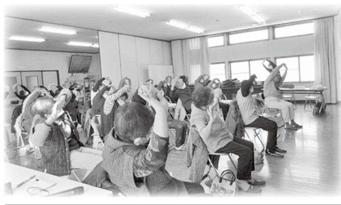
明科 サロン(潮沢地区)