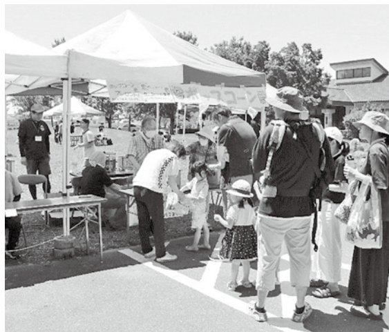
わんぱく広場ふれあいまつりの様子(穂高)