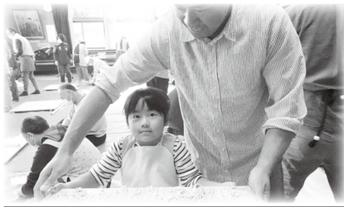
堀金 小田多井地区 そば打ち体験交流会

(有)元禄吉田屋 小出石材 (有)国明設備工業 小林建築 小山歯科医院 坂本屋 (有)三幸紙器 (有)サン・コンサルタンツ 支那そばあびすや 下里整骨院 (有)松月堂西村商店 信越機工(株) (株)シンシュウカワラ (株)信陽 大三ブロック工業(株) 高野屋 高原接骨院 宅老所ななきの里 (有)竹内組 (有)竹内建設 (株)辰巳 筑北木材建設(株) (株)ちくま精機 中信物産(有) デリシアあかしな店 天平の森 塔の原内川医院 特別養護老人ホーム孝明館 どんぐり薬局 中井自動車(株) 林歯科医院 (株)ヒューテック 福寿屋 (有)降幡自動車整備工場