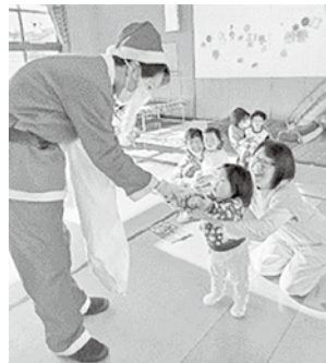
高家児童館「クリスマス会」の様子

児童館が企画して参加していただくものと、保護者の皆さまがグループに分かれて企画して行うグループ活動があります。親子の出会いや体験、健やかな成長を応援させていただきます。