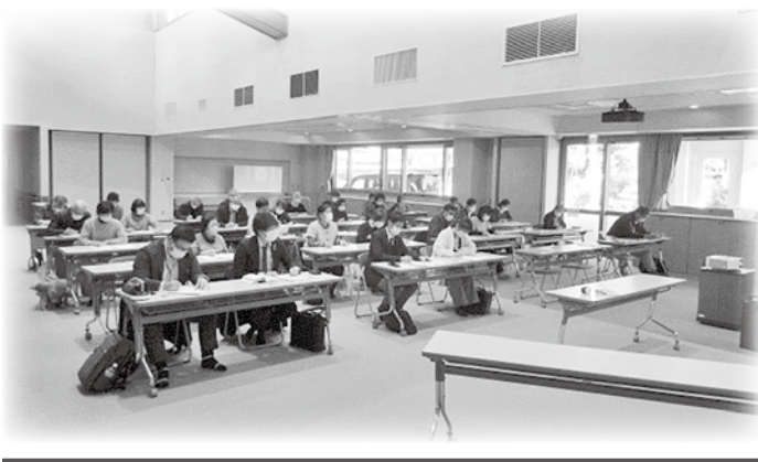
明科 認知症サポーター養成講座