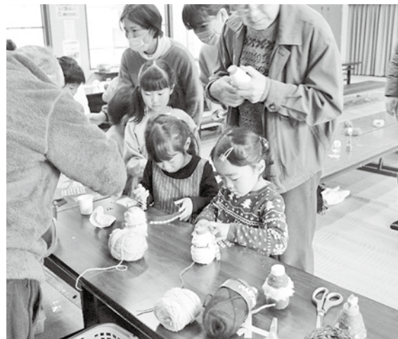
おむすび会「工作」の様子(堀金)