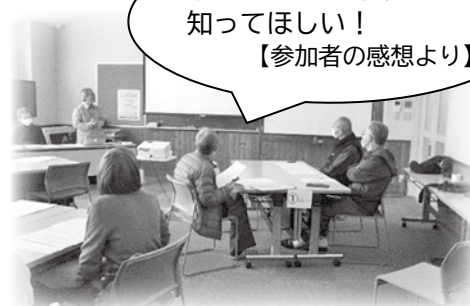
「地域連携担当教諭からの説明」