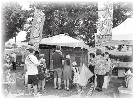
社協各支所福祉まつり