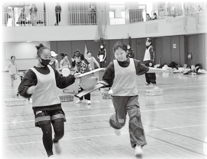
安曇野市9児童館合同アツミンピック みんなで運動会