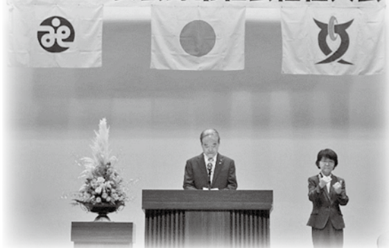
安曇野市社会福祉大会