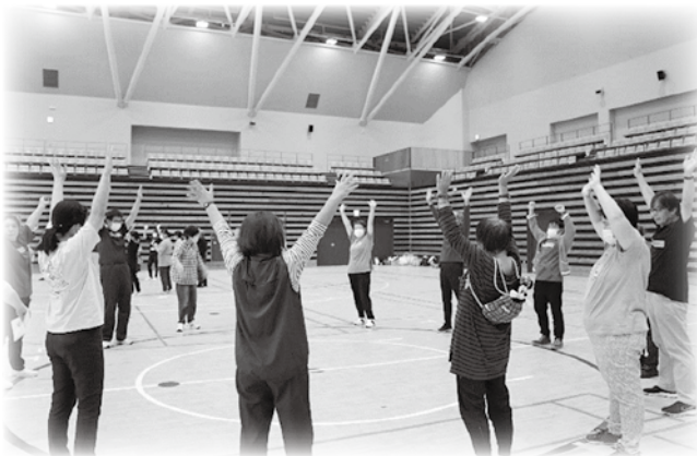
就労支援事業所すてっぷワークの交流会