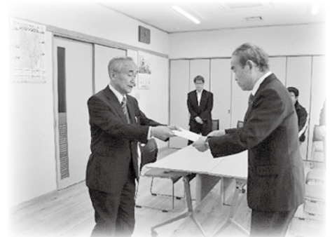
理事会・評議員会あり方検討委員会からの答申