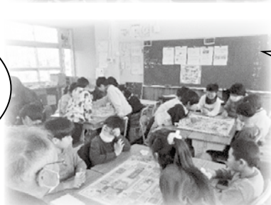
④防災ゲーム 社協職員企画