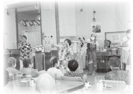
デイサービスセンター「夏祭り」