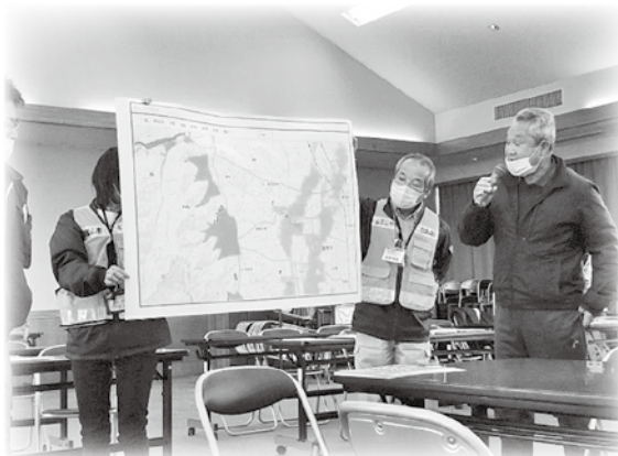
災害ボランティアサポーター養成講座