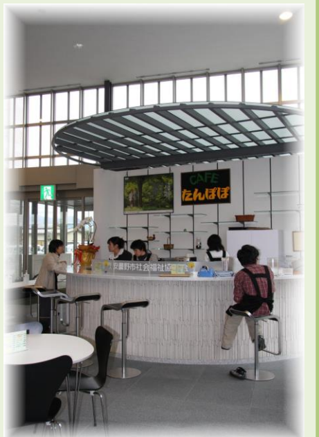
「Café たんぽぽ」(穂高「みらい」内)

一人での外出が困難な方に対して安全かつ円滑に外出できるようヘルパーが支援します。