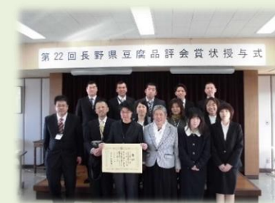
「長野県豆腐品評会」で、ま・めぞんのお豆腐が4年連続入賞しました。

障がいのある方の相談に応じて、利用者がより生活しやすくなる環境整備のために、また利用者の日中活動や就労の場を見出すために障がい福祉サービスの計画を作成します。