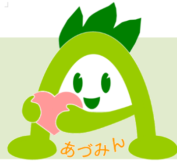
安曇野市社協マスコットキャラクター 『あづみん』