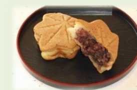
皆さんから好評の「かえで焼き」

障がいがあっても、本人の持っている可能性を見つめ、最大限の能力を発揮できるよう、おひとりおひとりの人生の「すてっぷ」を支援しています。