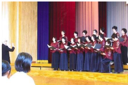
2011年度 安曇野市三郷地域 市民ふれあいコンサート 10月22日(土)

月2～3回木曜日の夜、三郷公民館で楽しく練習しています。デイサービス訪問時の曲や三郷地域ふれあいコンサート参加の曲を練習をしています。