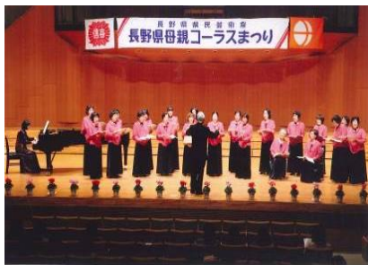
第50回 長野県母親コーラスまつり 平成21年11月3日・4日 松本善文ホール