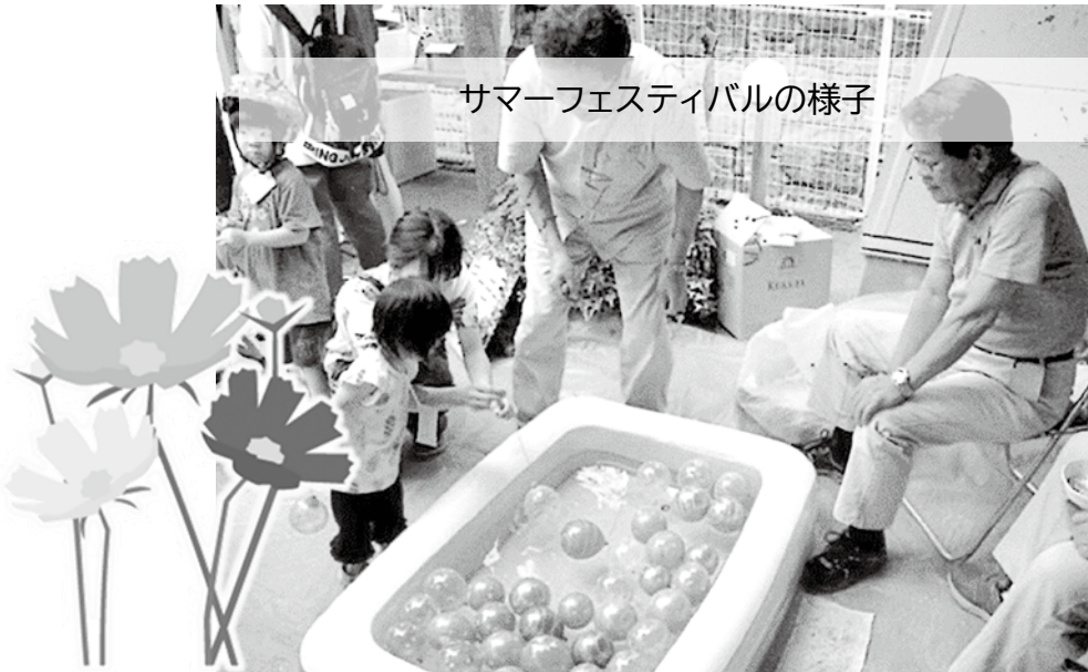
サマーフェスティバルの様子

また、地区社協は、育成会主催のサマーフェスティバルや三九郎にも協賛という形で参加し、たくさん子どもたちに楽しんでもらっています。