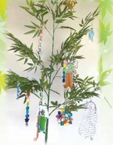
セタ用の竹をみんなで飾りつけました。