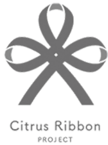
Citrus Ribbon PROJECT

セイコーエプソン労働組合豊科支部 株式会社パソナ北信越営業部 勝野建材株式会社 西穂高児童館保育支援ボランティア ボランティアグループ チームなでしこ クラブボランティア