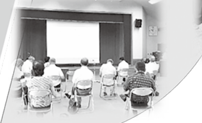
災害時住民支え合いマップ研修