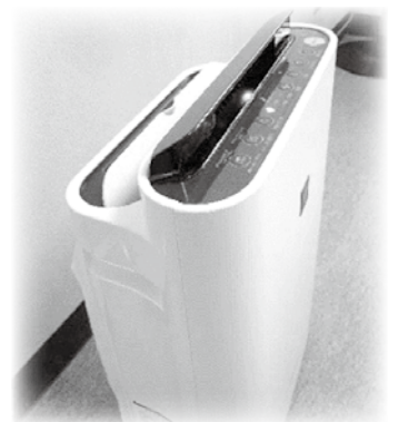
ご寄付いただいたもの(一例)