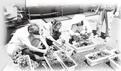
支部社協での「花植え事業」