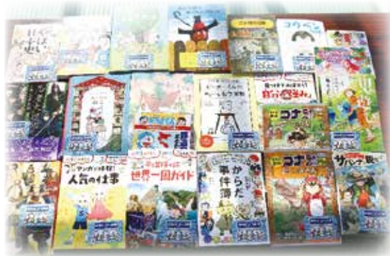
今回寄贈された書籍の一部