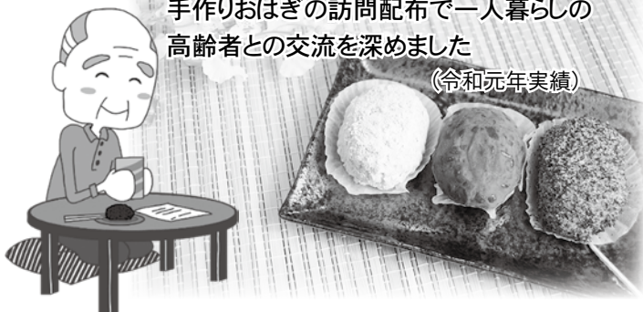
手作りおはぎの訪問配布で一人暮らしの高齢者との交流を深めました (令和元年実績)

新しい生活様式を取り入れながら、一日も早く、こういった福祉活動が以前のように行える日が来ることを待ち望んでいます。