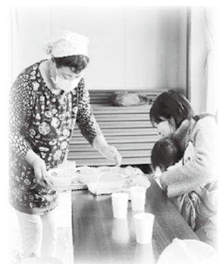
いただいた食材を使った「おむすび会」の様子

ご寄付いただいた金員や物品は、寄付者の皆さまのお志に沿って、大切に使用させていただきます。