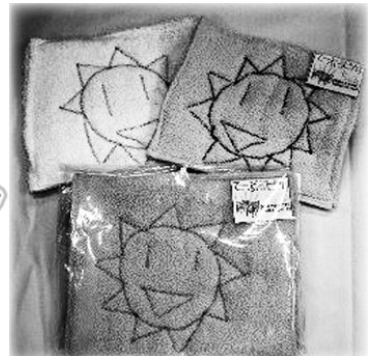
タオルが「台ふき」に

すてっぷワークの各事業所では、施設ごとに個性あふれる自主製品を製作・販売しています。また、販売による収益は、利用者様の工賃になります。そうした製品の材料の一部に「タオル」を使用しております。については、不要の未使用タオルがありましたら、ご提供いただけますでしょうか。ご連絡をいただければ伺います。また、直接お持ちいただいても結構です。皆さまのご協力をなにとぞよろしくお願いいたします。