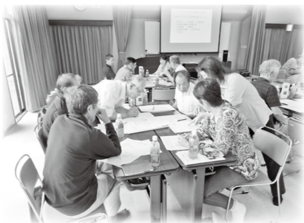
研修会では、マップの完成をめざし、話し合いを進めました。

社協堀金支部主催の「災害時住民支え合いマップ研修会」において、「上堀地区は第一段階の防災マップで終わっている。本年度は安曇野市避難行動要支援者名簿によるマップへの落とし込みを行い、第二段階