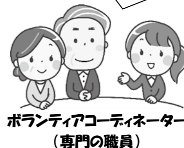
ボランティアコーディネーター (専門の職員)