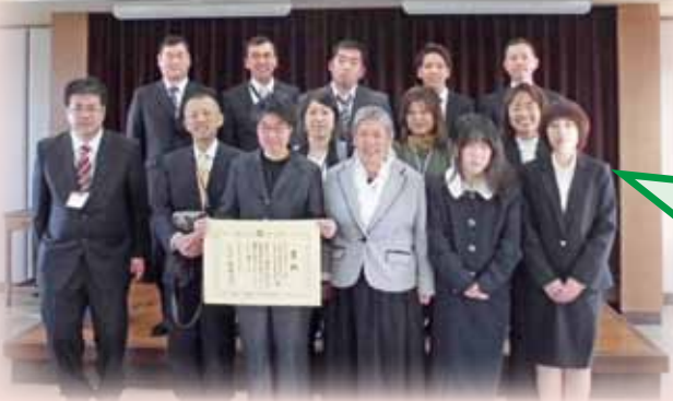
第22回長野県豆腐品評会賞状授与式

県内の豆腐専門店や老舗が参加する品評会での、最優秀賞に次ぐ賞の受賞で、ご利用者様、職員ともに喜びと感謝の気持ちでいっぱいです。