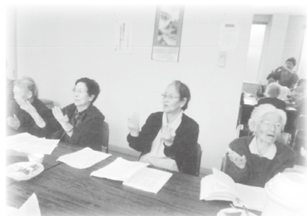
現在までの皆勤の方が7名いらっしゃいます。また、参加者の最高齢の方は92歳です。