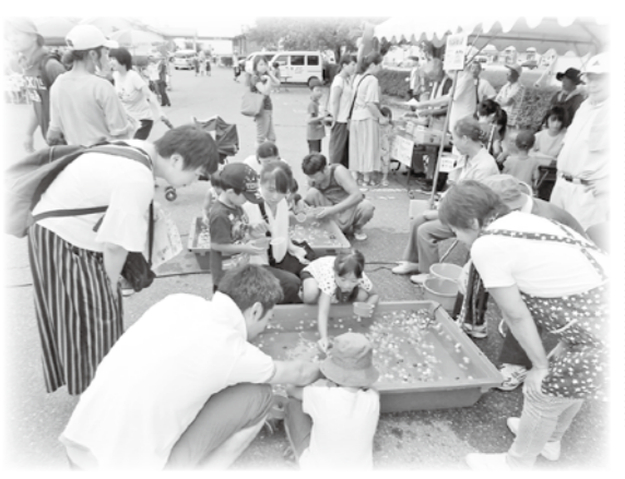
堀金 ふれあい祭り

安曇野市内には84の地区社協があり、それぞれの地域にそれぞれの活動があります。今回も地区社協の活動をご紹介します。