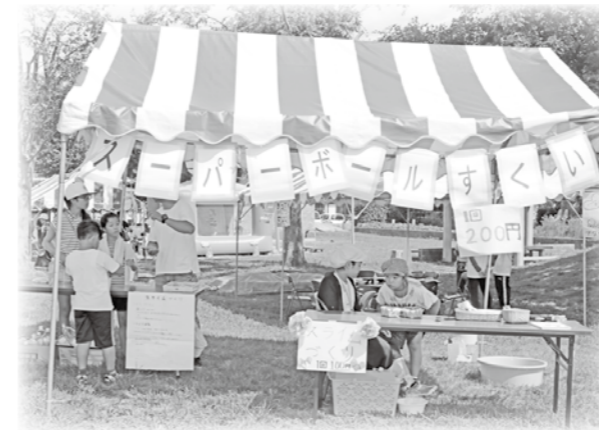
わんぱく広場ふれあいまつり