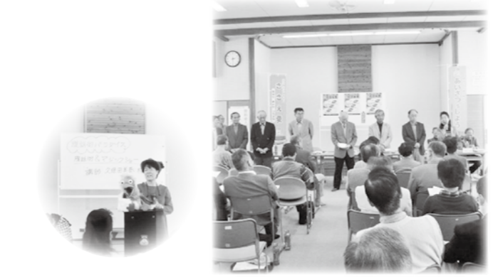
豊科支部社協 総会