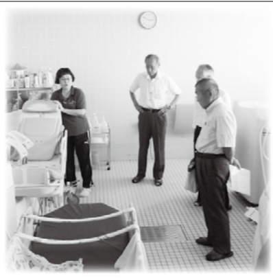
三郷支部社協 社協事業所視察研修会

水 上 製 作 所 H A M A フ ラ ー パ ー ク 安 曇 野 犬 の 美 容 室 ク ウ ー S A N 一 日 市 場 新 聞 販 売 丑 山 自 動 車 ( 有 ) 二 木 建 築 ( 有 ) 松 本 ゼ ミ ナ ー ル 築 ( 有 ) 久 根 下 商 店 ( 有 ) あ り が と 機 器 ( 有 ) 三 友 電 機 ( 有 ) サ ン シ ン エ キ ス プ レ ス 苑 庭 園 そ ば 処 み さ と ( 有 ) 大 久 保 自 動 車 新 光 電 気 工 事 園 丑 山 プ レ シ ュ ン ( 有 ) 多 田 プ レ シ ュ ン ( 株 ) 中 島 鐵 工 所