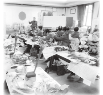
豊科新田地区社協 フワアレンジメント講習