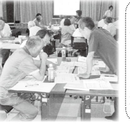
穂高地域 災害時住民支えあいマップ研修会