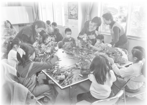
綺麗に出来上がってきました。

七日市場地区のいきいきサロンは、民生委員さんの協力を得て、年間を通して実施しています。5月に、お料理ボランティア「さつき会」の方々に黒糖まんじゅうの作り方を教えてもらって、『おやつ作り』を行いました。男女合わせて約30名の皆さんで協力して、おいしいおやつを作りました。12月には、地区社協が主体となつて子どもと高齢者が触れ合う『交流会』を開催しました。七日市場コミュニティセンターを会場に、世代を超えた地区の皆さん約50名が