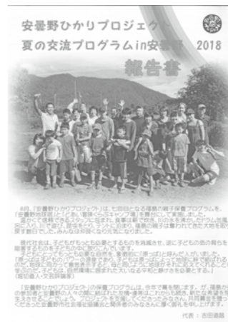
プロジェクトの報告書

このプロジェクトは今回で幕を閉じますが、プロジェクトを支援して下さった皆さん、関係者の皆さんに厚く御礼を申し上げます。