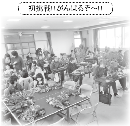
初挑戦!!がんばるぞ~!!

お正月用の生け花やフラワーアレンジメントに挑戦しました。生け花の作業が終わった後は、お茶会を行い、地域の住民の皆さんが交流する時間を作っています。同じ地区で暮らしていても、普段はなかなか交流する機会が少なくなつてきていると思います。その中でも少しでも住民同士が触れ合える機会を作ることで、温かく、助け合える地域になつていければ良いなと思つています。