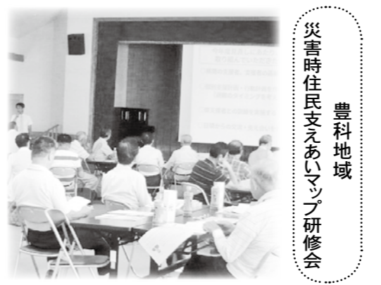
豊科地域 災害時住民支えあいマップ研修会