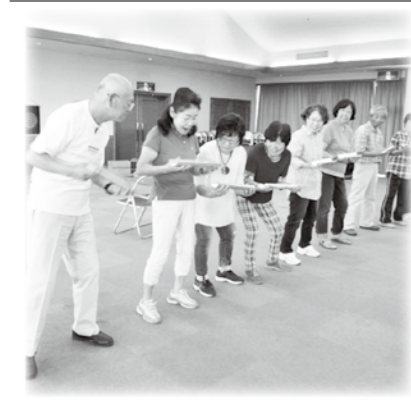
豊科支部社協 レクリエーション講座