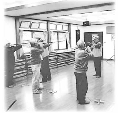
豊科踏込地区社協 吹き矢教室