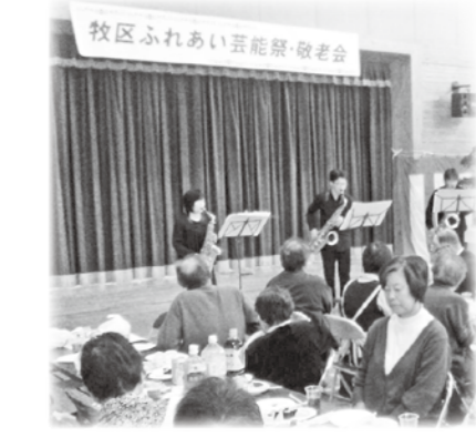
穂高地域 牧地区芸能祭・敬老会