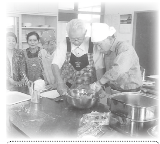
協力して、ていねいに混ぜています。

三郷・七日市場地区社協 七日市場地区は、三郷地域の南、松本市梓川と隣接している場所に位置しています。地区社協の活動は年間を通して、いきいきサロンやボランティア活動の支援のほか、一人暮らし高齢者との交流、子どもと高齢者の交流会の実施など、地域住民の関係づくりを深めています。