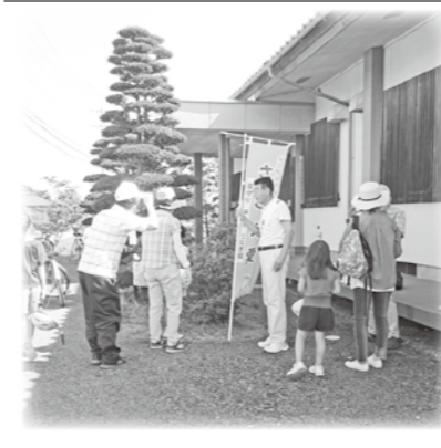
豊科熊倉地区社協 あいさつ運動