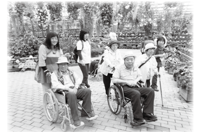
ふれあいバスの旅の様子