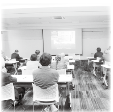
穂高支部社協 役員視察研修