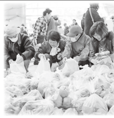
社協三郷支所 みさとふれあいマーケット

( 有 ) 中 嶋 工 設 備 中 パ テ ッ ク ( 株 ) 業 備 ス パ テ ッ ク ( 株 ) 業 備 中 萱 医 院 ( 株 ) 院 中 な か た 整 骨 院 ( 株 ) 院 ア ル フ ァ 機 械 産 業 ( 株 ) 院 中 島 整 骨 院 ( 株 ) 院 や ま び こ 動 物 病 院 ( 株 ) 院 ( 農 ) 中 信 え の き 培 養 セ ン タ ー イ ブ キ 建 設 ( 株 ) 院 も も セ ク リ ニ ッ ク ( 株 ) 院 永 森 社 会 保 険 労 務 士 事 務 所 サ ロ ン ド ヤ マ キ 遊 花 工 房 食 事 処 I K O I 高 橋 精 肉 店 池 田 医 院 御 食 事 処 七 福 院 長 幸 製 菓 園 丸 本 幸 製 菓 園 ( 有 ) 信 濃 自 動 車 セ プ ン イ レ ン 安 曇 野 温 店 H I Y O K O 中 村 整 骨 院 ( 有 ) 中 福 田 瓦 骨 店 ( 有 ) イン テ リ ア 曾 山 店 お く は ら 動 物 病 院 デ イ サ ー ビ ス ま が り と 太 田 屋 ビ ュ ー テ ー サ ロ ン ・ ツ ル ミ