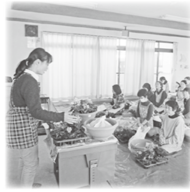
穂高地域 穂高地区・寄せ植え教室

( 有 ) 那 須 野 石 油 安 曇 野 ワ イ ナ リ ー ( 株 ) ( 株 ) 信 州 グ リ ー ン ( 株 ) に こ に こ 不 動 産 ( 有 ) N P O 法 人 子 育 て 支 援 ぱ お ( 有 ) 中 澤 電 気 商 会 ( 有 ) 赤 羽 中 歯 科 医 院 赤 羽 中 歯 科 医 院 松 本 シ ェ ル 石 油 ( 株 ) 三 郷 給 油 所 ( 株 ) 穂 高 観 光 食 品 富 士 開 発 ( 株 ) 松 本 広 域 森 林 組 合 ( 有 ) 牛 夕 力 合 尾 和 牛 厨 房 会 柴 澤 商 骨 会 平 澤 整 骨 院 布 山 齒 科 医 院