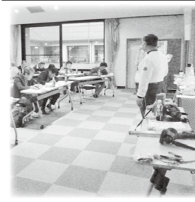
穂高支部社協 災害軽減講座

( 株 ) マ ル イ チ マ シ ン ( 有 ) 小 田 切 医 院 ( 株 ) 小 田 切 医 院 ( 株 ) テ ル キ ヤ ビ ン C ( 株 ) ア ス ト 口 電 機 ( 株 ) 武 井 組 ( 有 ) 石 川 モ ー タ ー ス ( 有 ) 丸 正 小 林 建 設 ( 有 ) 山 上 丸 山 商 店 ( 株 ) ヤ マ コ シ ( 株 ) 安 曇 野 肉 の マ ル ト 共 和 ア ス コ ン ( 株 ) 共 和 ア ス コ ン ( 株 ) 三 陽 商 事 ( 有 ) あ づ み 野 支 店 東 洋 計 器 ( 株 ) 穂 高 ビ ュ ー ホ テ ル ( 株 ) ( 株 ) ラ イ ソ ー ト 泉 郷 ホ テ ル ( 株 ) 安 曇 野 満 願 寺 な で し こ や ( 株 ) 穂 高 電 気 工 事 店 ( 有 ) 渡 辺 わ さ び ( 株 ) 内 堀 食 品 店 ( 株 ) セ プ ン イ レ ン 安 曇 野 穂 高 店 ( 株 ) ア ス テ ッ プ 信 州 ( 株 ) 穂 高 製 作 所 ( 株 ) 松 澤 虹 の 村 診 療 所 高 山 商 工 所 ( 有 )