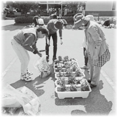
三郷支部社協 花植え事業

テ ン ホ ウ 穂 高 店 そ ば 処 寿 々 菰 介 護 老 人 保 健 施 設 孝 穂 館 く ま こ ろ う あ づ み 野 店 有 明 歯 科 山 本 歯 科 ク リ ニ ッ ク リ ー フ 動 物 病 院 み さ わ 動 物 病 院 ( 補 有 明 会 介 護 老 人 保 健 施 設 有 明 苑 ) サ ン ク ス さ い わ い の 街 有 料 老 人 ホ ー ム む つ む の 郷 ほ た か D E L I + D E L I ◆ その他 ( 有 ) 久 保 田 屋 精 肉 店 ( 有 ) 岡 江 組