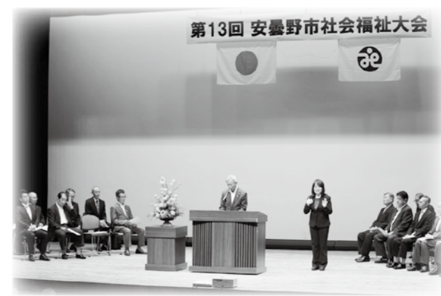
安曇野市社会福祉大会

■賛助会員とは、社協が行っている地域福祉活動に特別のご理解をいただいている皆さまです。 ■敬称は省略させていただきます。 ■順不同とさせていただきます。 ■多数の方に協力いただいたため、5,000円以上の方のみ掲載させていただきます。ご了承ください。