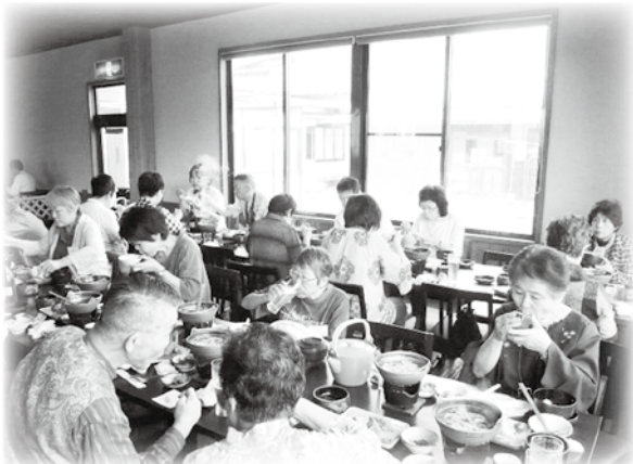
富士山が見える食事処で、昼食タイム。