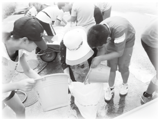
〈昨年の様子〉 水を入れて作った「水のう」を使って、運動会(リレー)を行いました。