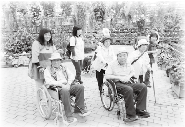
手入れが行き届いた花は、素晴らしかったです。

花と鳥の別天地「富士花鳥園」を見学し、富士山の眺望がすばらしい「もちや」で昼食・お買い物を楽しみました。「道の駅朝霧高原」にも立ち寄りながら、ふれあいと笑顔あふれる旅となりました。