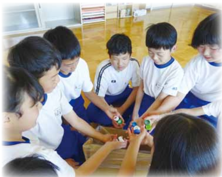
全校でエコキャップを集めてイオン豊科店に持って行き、ワクチン支援などに協力しています。