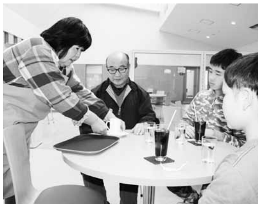
3月にオープンした「カフェ董」の様子

「三郷すみれ」の郷は三郷交流学習センターにおいて「カフェ董」をオープンしました。