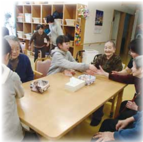
音楽クラブは福祉施設で演奏や交流活動をしています。