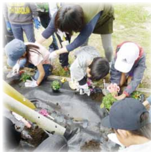
地区児童会で地域の花壇に花を植えて、地域を花いっぱいになります。