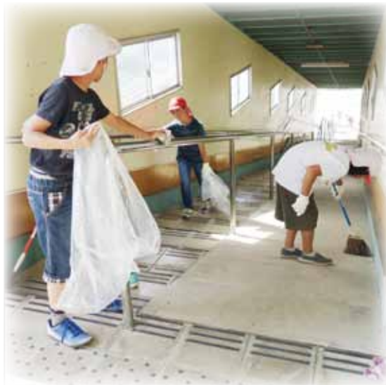
ボランティア委員会が通学路にある陸橋を掃除しています。綺麗になると気持ちがいいです。

市内にある学校の、児童や生徒さんが「ふくし」に携わる様子などを写真でご紹介します。