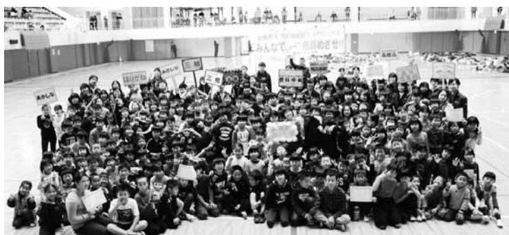
昨年11月には「第3回 9児童館対抗ドッチビー大会」を開催しました。

また、北部地域包括支援センターについても今年度から5年間、業務委託を受けることとなりました。