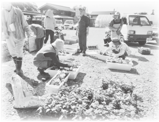
綺麗な寄せ植えが出来上がりました。

5月中旬、寄せ植えプランター作りを行いました。ペチュニア・サルビア・初雪草など数種類の苗を約60個のプランターに植え、各家庭有志の方へ配付し、水やりなどの管理を行いました。