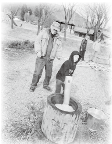
親子もちつき大会「杵と臼でついたお餅は美味しいな」

11月初旬の収穫後には、「焼き芋大会」を行いました。今年は小雨の中の実施で例年より参加者が少ないながらも約30名の皆さんで、焼き立てのお芋や、一緒に作った大学芋を喜んで食べていただきました。