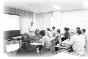
パソコン講座の様子

「安曇野パソコンボランティア」と「安曇野パソコンクラブ」の会長をしております。主な活動は、地域のパソコン初心者やシニア層を対象にした、「初心者パソコン講座」と「パソコンクラブ学習会」の定期開催です。私とパソコンとの関わりは、情報化社会と言われ始めた1990年代後半「マイクロソフト社」が発売した「Windows95」との出会いからでした。定年退職後、仕事で使ってきたパソコンを本格的に学ぼうと、メーカーが認定する指導者養成講座を受け資格を取得し、2003年10月に当時の「豊科町社会福祉協議会」の「ご指導をいただき「豊科パソコンボランティアの会」を設立しました。以来、今年で15年目に入り利用者も延べ2700名程になりますが、活動が継続出来ている理由として考えられるのは、「好きなパソコンが媒体」「人の役に立っている実感」「同じ志を持つ仲間がいた」だと思います。自分の経験から、男性は会社人間の人が多く地域との馴染みが少ないですが、一歩勇気を持って地域の活動に踏み出せば、人とのつながりが広がります。