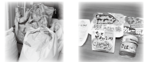
当日の様子と、ご寄付いただいた食料品

■問合せ 社協本所内 「まいさぼ安曇野」 担当：藤澤・加藤 電話：88-8707