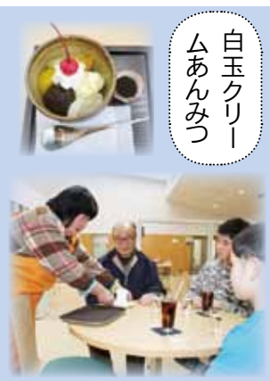
「お待たせしました」

『すてっぷワーク Cafe 重(すみれ)』は三郷交流学習センター「ゆりのき」に、3月10日オープンしました。