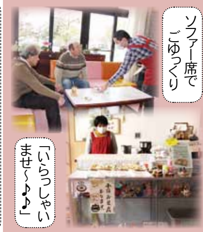
「いらっしゃいませ」