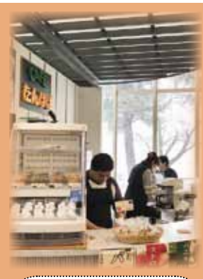
コーヒーとジュースを用意しています

【豊科たんぽぽ】と【堀金かえでの家】が交代で運営しています。種類は限られますが、それぞれの自主製品もお買い求めいただけます。