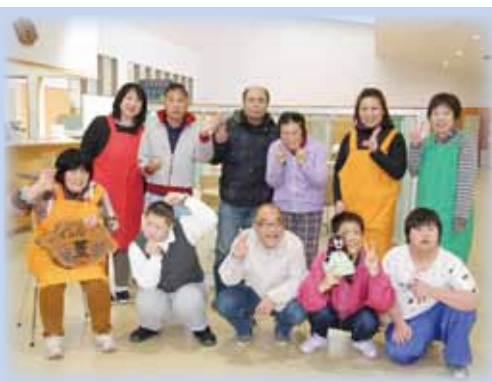
わたしたちが皆さまのお越しをお待ちしております♪

『すてっぷワーク Cafe 重(すみれ)』は三郷交流学習センター「ゆりのき」に、3月10日オープンしました。