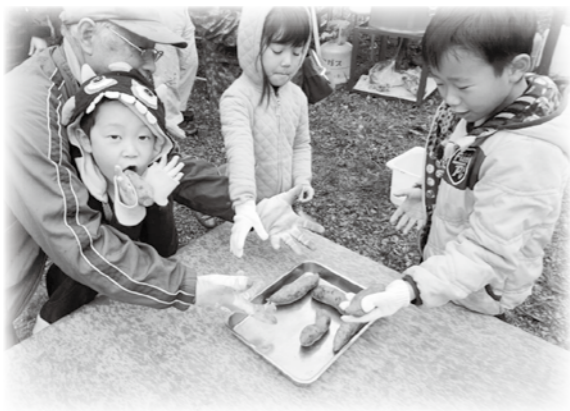
焼き芋も大学芋もとてもおいしかったです。

また、区内の沿道の花壇にも花を植え、多くの皆さんに楽しんでいただいています。国営公園の入り口の地区でもあり、この活動は環境美化にも役立っています。