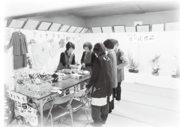
書道、絵画、生け花など多岐にわたる展示作品

つに「新屋文化祭」があります。書道、絵画、写真、手工芸等、区の皆さんが日頃取り組んでいる作品を一堂に集めて展示しました。また、音楽、踊り等の発表もありました。屋外では、焼き芋、岩魚の塩焼き、ビンゴ大会、豚汁の試食会等も行いました。これからも、区民の交流の機会を増やし、区の活性化に取り組んでいきたいと思えます。