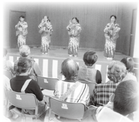
新屋民謡クラブの踊り

つに「新屋文化祭」があります。書道、絵画、写真、手工芸等、区の皆さんが日頃取り組んでいる作品を一堂に集めて展示しました。また、音楽、踊り等の発表もありました。屋外では、焼き芋、岩魚の塩焼き、ビンゴ大会、豚汁の試食会等も行いました。これからも、区民の交流の機会を増やし、区の活性化に取り組んでいきたいと思えます。