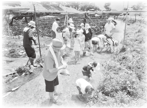
ニジマスのつかみ取りをして、美味しく食べました

安曇野市内には84の地区社協があり、それぞれの地域にそれぞれの活動があります。今回も地区社協の活動をご紹介します。