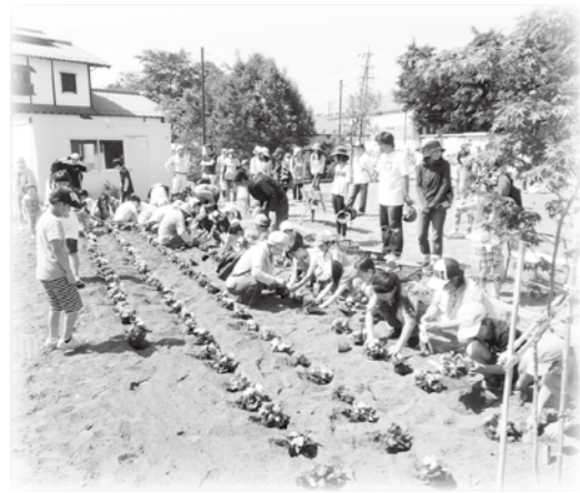
ペゴニアを植え、親子で花壇づくり

等々力町地区社協では、白寿会（老人クラブ）の皆さんのご指導のもと、北城公園内に子どもたちと保護者で花壇づくりを行っています。完成後はボランティア会の皆さんに管理を引き受けていただきました。また、夏には小学生を対象に自然を学ぶ「親子水のふれあい」を開催しました。穂高川河川敷のゴミ拾いを行い、ニジマスの稚魚を放流しました。その後はニジマスのつかみ取りをして、塩焼きにして食べました。