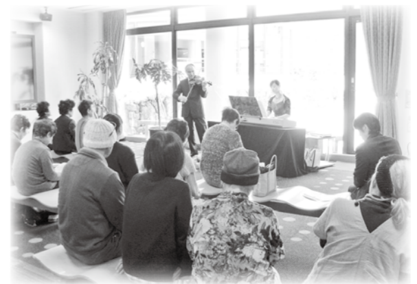
昨年はヴァイオリンの演奏を楽しみました