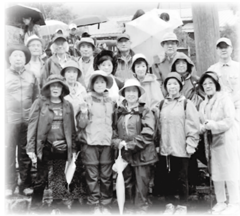
「山の日」制定を祝って、初夏の上高地へ

豊科・踏入地区社協は、区長を副会長に7つの「いきいき健康教室」の室長と3つのサロンの代表、民生児童委員、子ども会育成会会長、代表氏子総代、公民館長、健康づくり推進委員長、3地区委員、サポート委員で構成されています。