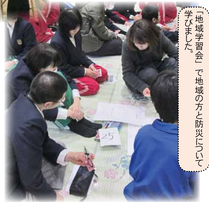
「地域学習会」で地域の方と防災について学びました。