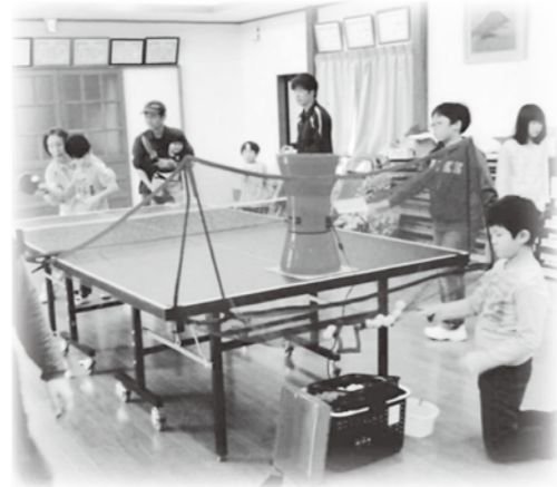
球出し機を使って「子ども卓球教室」

安曇野市内には84の地区社協があり、それぞれの地域にそれぞれの活動があります。今回も地区社協の活動をご紹介します。