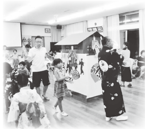
地域の皆さんで賑わった納涼夏祭り

参加人数が50人増え、大盛況でした。今年度はどの行事も参加人数が増えており、地域の皆さまに感謝いたします。