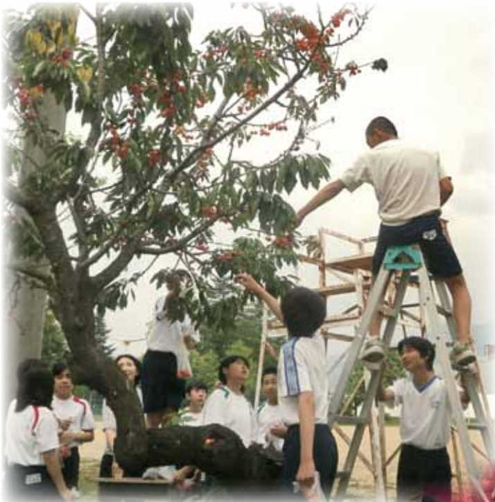
さくらんぼを収穫し、三郷のデイサービスの方に届けました。