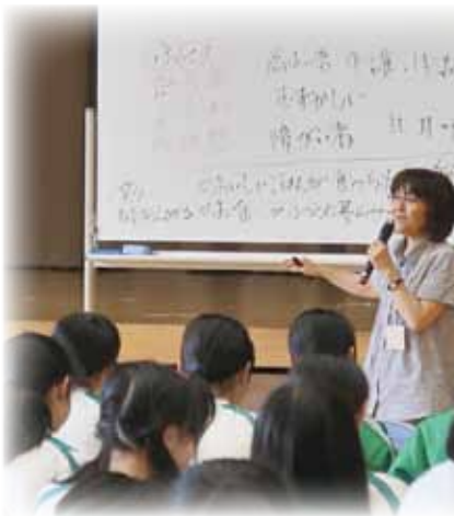
1年生が総合的な学習で三郷の福祉について学びました。