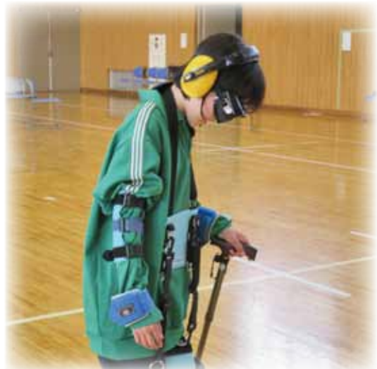
高齢者の方の「困難さ」を体験し、どのような支援が必要か考えました。