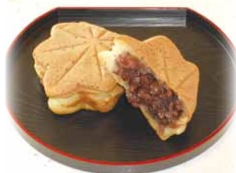
『かえで焼き』粒あん 1個100円

『かえで焼き』 カエデの葉をモチーフにしたこの商品、名前も事業所にちなんでいます。ふんわりとした皮と、北海道産小豆をたっぷり使用した甘さ控えめの粒あんが特徴です。