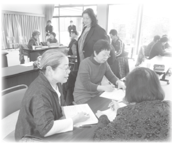
安心コールボランティア養成講座の様子 (2月17日開催)

■締切 4月28日(金) ■問合せ・申込み 豊科ささえあいセンターにじ 電話72・3013