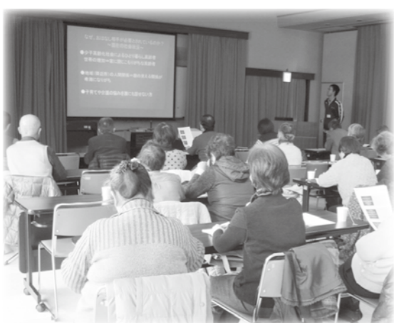
おはなし相手ボランティア養成講座の様子 (1月27日開催)