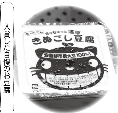
入賞した自慢のお豆腐

「きぬこし豆腐」と濃厚きぬこし豆腐 は、安曇野市産の大豆「ナカセ ナリ」を使用した商品で、濃度12 %以上の豆乳と天然のりがりを使 用しています。大豆の豊かな香りと 甘みを感じられ、滑らかな食感が 特長です。 お豆腐の他にも、ソフトクリーム や豆乳おからドーナツなども販売し ておりますので、ぜひお立ち寄りく ださい。 ■問合せ すてっぷワクま・めぞん 電話88・8506 安曇野市豊科4678-2