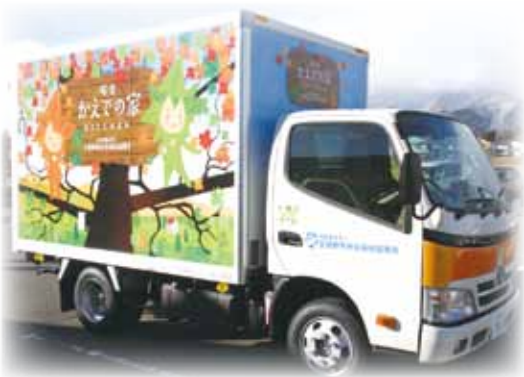
社会福祉法人清水基金様の助成で購入させていただきました

主に社協堀金支所駐車場で販売しておりますが、4月からはほりがね物産センター様、HAMAFラワーパーク安曇野様でも定期販売をさせていただきます。また、社協各支所や地域のイベントへも出かけていきたいと思います。どうぞよろしくお願いいたします。