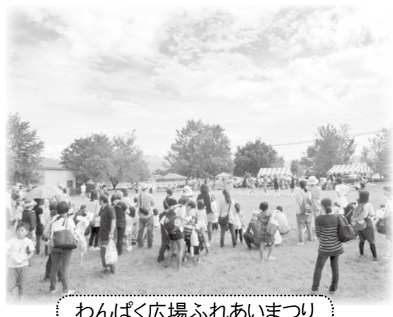
わんぱく広場ふれあいまつり