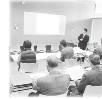
穂高支部社協 軽井沢町視察研修