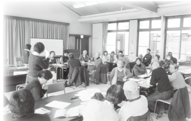
グループに分かれて意見交換

住み慣れた地域でイキイキと暮らしていくために、地域のリーダー的役割「世話やきさん」が必要とされています。 『地域の世話やきさん講座』では4回シリーズ（1月20日・27日・2月3日・10日）で、世話やきさんのお役に立つ学びの場を開催しました。 1回目は「住民主体の地域づくりを学ぼう」と題し、1月20日に約30名の方が参加しました。介護保険の改正やそれに伴う地域での「支えあい」の体制づくり事業などについて学びました。 「あなたの「近所付きあい」について意見交換を行い、やっていること・困っていることなど、「近所で声を掛けあって実施している支えあいについて、具体的な活動を沢山知ることができました。」