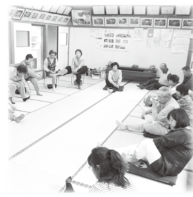
明科 町地区社協 こぎこきサロン

健明会 やざき診療所 花乃 園茶舗 原田 建築工房 明科 第一交通 明科 サン・コンサルタンツ ほっとハウスあかしなの家 加登 屋商店 ニット ショップ内山 高 大堀 住設 伊 岩 野 工務店 伊 藤 医 務 院 エムズ 合同 会社 松村 歯科 医院 特別 養護 老人ホーム 孝明館 波 場 建 設 株式会社 小規模多機能型居宅介護ななきの家 (有)降幡自動車整備工場