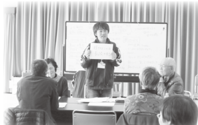
ご近所付きあい・・・結構やってます!