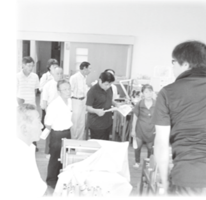
穂高支部社協 市内視察研修