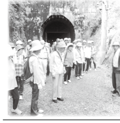
明科 支部社協 交流会

特別会員地域別件数 ◆豊科 276件 ◆穂高 235件 ◆三郷 113件 ◆堀金 67件 ◆明科 128件 ◆合計 819件 5,253,000円