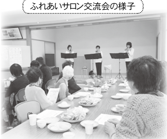
ふれあいサロン交流会の様子

暮れには「もちつき大会」や「健康教室」なども開催し、地域の皆さんとのふれあいの場を広げています。「ふれあいサロン」は2回開催し、お茶を飲みながらオカリナの演奏やキーボードの伴奏で歌をうたい、楽しい時間を過ごしました。 穂高・白金地区社協 私たち白金地区社協・ボランティア会は、春には2カ所の老人施設で清掃活動を行っています。また、敬老の日には、日頃地域の見守りをし