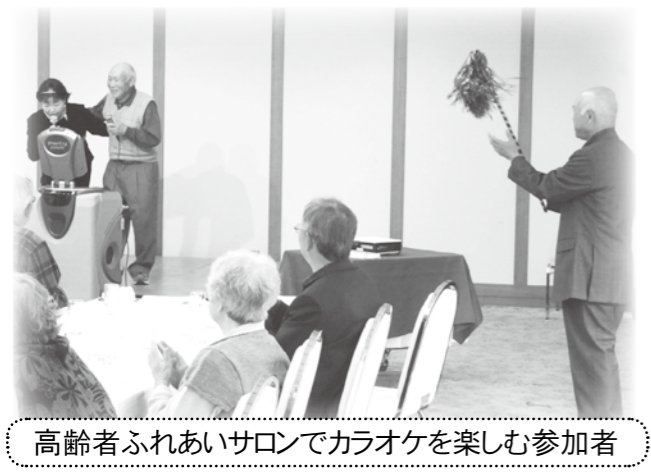
高齢者ふれあいサロンでカラオケを楽しむ参加者

てくださっている75歳以上の皆さまに感謝の意を込めて、ささやかな贈り物を戸別にお届けし、健康寿命を祈念しています。 子ども育成会では「七夕ふれあいサロン」の中で七夕饅頭や七夕飾りを、「三九郎」ではまゆ玉づくりの指導を行い、子どもや保護者と一緒に伝統行事の継承に努めています。 10月には恒例の「高齢者ふれあいサロン」を実施し、今年も特殊詐