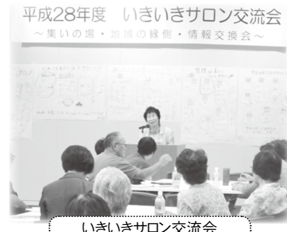
いきいきサロン交流会