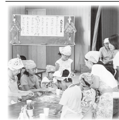
豊科成相地区社協 世代間交流七夕まつり