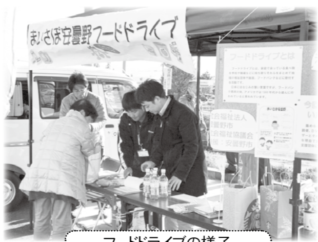
フードドライブの様子

平成28年12月10日に実施しました『まいさば安曇野フードドライブ』、多くの方のご理解と協力により、500円以上の食べ物（カップ麺等）250点、缶詰120点、レトルト食品30点、その他130点、お米に関しては300kg以上もの寄付をいただきました。本当にありがとうございました。今回「寄付いただいた食べ物は、まいさば安曇野で相談を受けた方の中で、食べ物にお困りの方々のお手元に届けさせていただきます。」