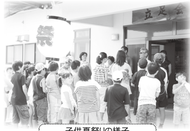
子供夏祭りの様子

立足地区社協では、育成会やPTA、健康づくり推進委員など関係団体と一緒に活動を進めています。夏には手づくりの「子供夏祭り」を企画し、子どもと家族150名ほどが集まり、工夫を凝らした手づくりのゲームを楽しみました。最後は皆でカレーを食べ楽しいひと時を過ごしました。