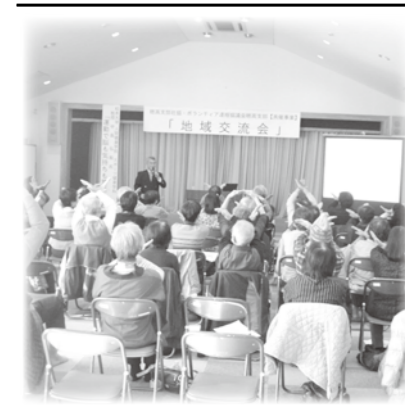
穂高支部社協 地域交流会