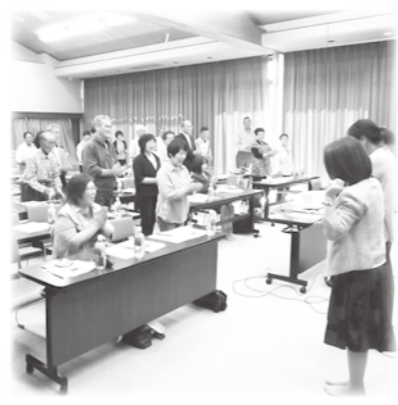
堀金 支部社協 認知症研修会

相和 プレス工業 株式会社 木村自動車整備工場 ほりでーゆー四季の郷 青柳 木工所 尾日向辰建築設計事務所 高橋 喜博 歯科 医院 内田 歯科 クリニック 内田 歯科 クリニック ヘアーサロン 本庄 割烹 田 工業 平倉 電気 商会 井出 製菓 安曇野 株式会社 須 砂 渡 食 堂