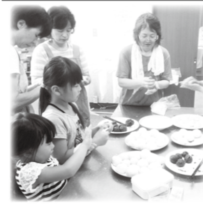
明科 大足地区社協 いきいきサロン

◆金30,000円 雲 龍 寺 ◆金10,000円 山十内川石油 株式会社 (有)明北電気工業 株式会社 (株)シンシュウカワラ 寺 給 然 建 寺 (株)中 村 工 (株)明 北 電 気 工 業 株式会社 山 富 産 業 株式会社 明科工場 山 富 産 業 株式会社 明科工場 山 富 産 業 株式会社 明科工場 山 富 産 業 株式会社 明科工場 山 富 産 業 株式会社 明科工場 山 富 産 業 株式会社 明科工場 山 富 産 業 株式会社 明科工場 山 富 産 業 株式会社 明科工場 山 富 産 業 株式会社 明科工場 山 富 産 業 株式会社 明科工場