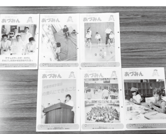
社協だよりあつみんの発行