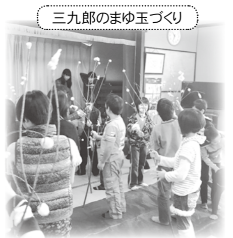
三九郎のまゆ玉づくり

欺防止の寸劇や脳トレゲーム、カラオケで和気あいあいの楽しい時間を過ごしました。参加者を多く募ることにより、地域活性化の一助になればと思っております。