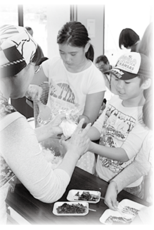
おむすびを頬張りました