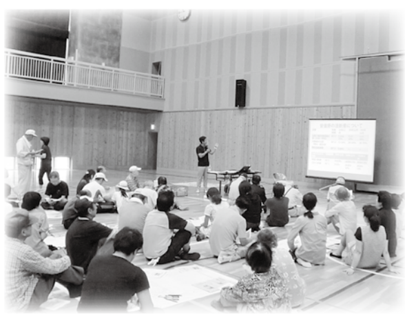
訓練の目的や演習方法を確認

町地区社協は、年数回のいきいきサロンのうち、1回は健康づくり推進委員との共催で「健康教室」を開催するなど区の組織と連携しながら、地域の人どうし、顔の見える関係づくりを目指した支えあい活動に積極的に取り組んでいます。