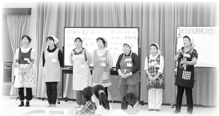
おむすびスタッフ(ボランティア)の皆さん