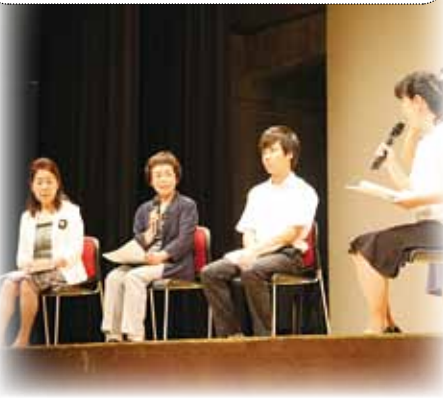
活動発表後インタビューの様子