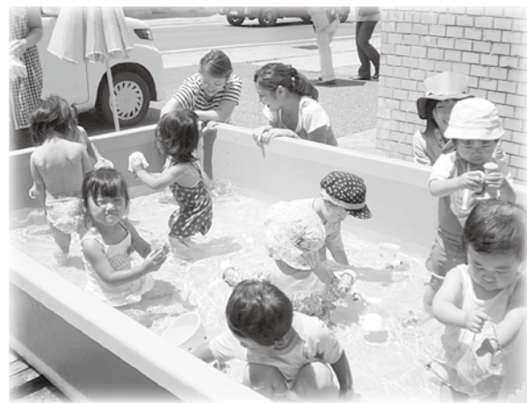
手づくりのお魚を捕まえたよ

市内各児童館で行っている就園前の親子を対象とした活動です。親子で様々な楽しい活動が体験できます。お住まいの地域での同年代のお子さんごとの活動なので、就園前に仲良しのお友達ができたり、子育ての話ができる保護者の輪も広がったりします。おばあちゃん・おじいちゃんとの参加も大歓迎です。