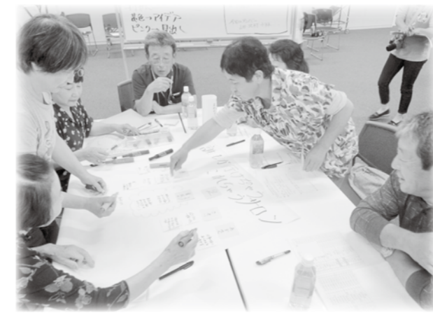
意見が飛び交います

7月9日(土)に安曇野市本庁舎において、平成28年度いきいきサロン交流会を開催しました。今回は4つのテーマに分かれてワークショップ形式でアイデアを出しあう情報交換会を行いました。120名の方が参加され、活発な意見や楽しいアイデアが次々と出され、充実した時間となりました。