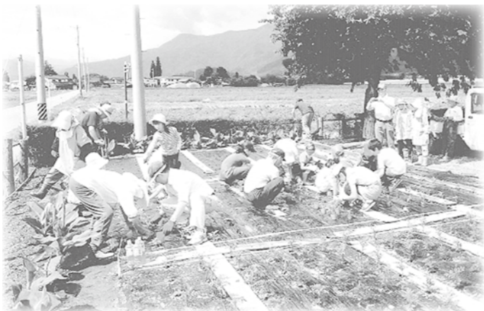
一緒に植えていきます