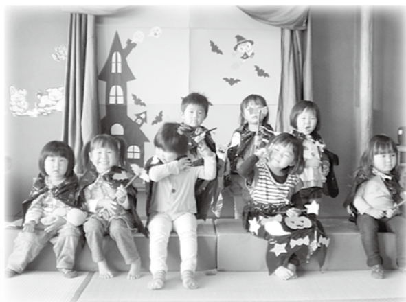
ハロウィンの仮装で、ハイチーズ