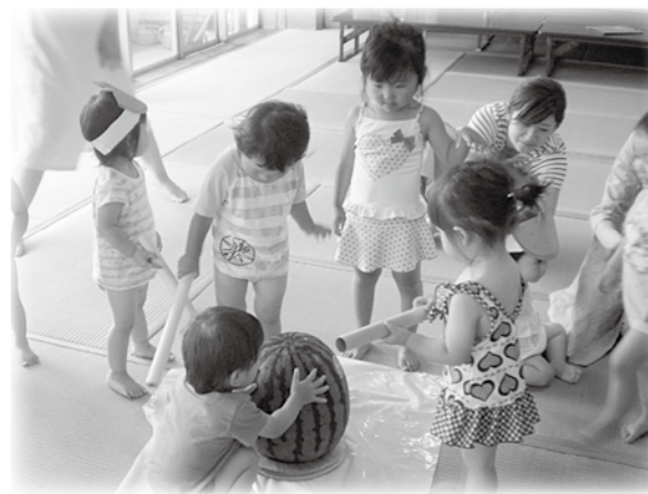
スイカ割り・・・なかなか割れません