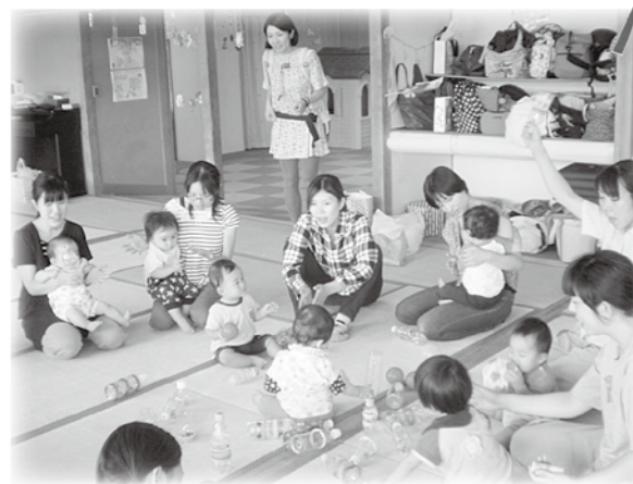
年齢に合った楽器づくり (ペットボトルマラカス)

焼き芋会・クリスマス会など季節行事、リズム遊び・運動会・遠足などの身体を動かす活動、食を育むおやつづくりなどがあります。また、参加者主体のグループ活動など様々な行事を行っています。 0歳児・1歳児・2歳児以上の3つのグループで活動します。 活動の中で専門の職員と共に、子育ての不安や悩みを語り合う「子育てすくすくトーク」も実施しています。