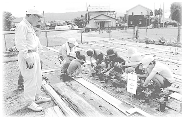
花の苗の植え方を教えてもらいました

その5つの事業は「老人と子供の交流会（花壇）」、「蕎麦打ち体験交流会」、「手作り弁当配達サービ