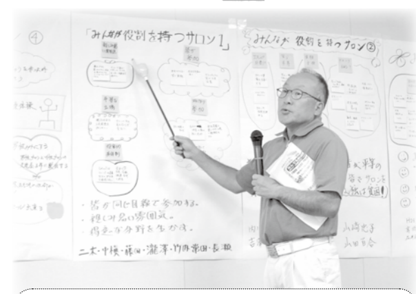
グループを代表して発表

■ふれあい・いきいきサロンとは？ 特別なことをする場所ではなく、誰もが気軽に寄り合うことのできる井戸端会議のようなものです。 安曇野市社協では、「いつでも」「だれでも」「どこでも」を合言葉に、ふれあい・いきいきサロンを推進しています。 「いつでも」月1回や毎週など、定期的を開催するのがサロン 「だれでも」子どもからお年寄りまで、2人以上いればサロン 「どこでも」気軽に寄り合える場所なら例え外でもサロン