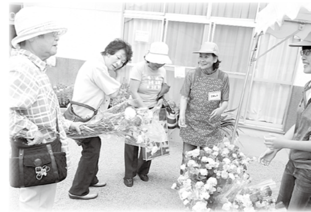
バザーではキレイなお花も販売しました