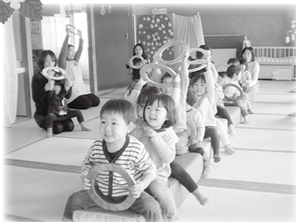
みんな大好き、バス体操